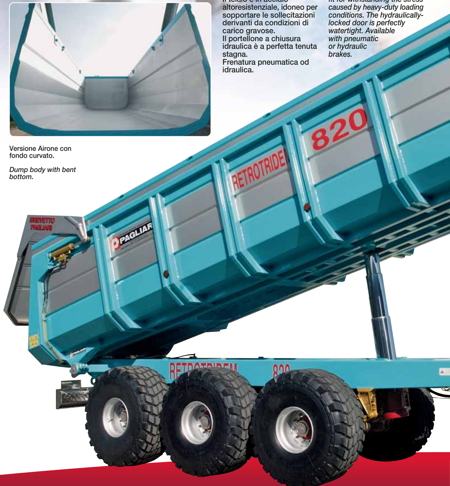
Dump body with bent bottom.