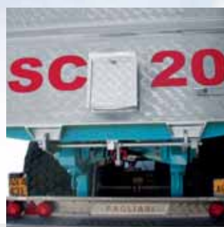
Bocchetta di scarico posteriore per la granella. Back opening for the unloading of grains.