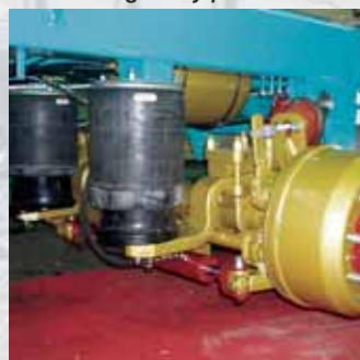
Sospensione pneumatica industriale, con valvola livellatrice e molla a ginocchio. Industrial-type pneumatic suspensions, with grading valve and knee spring.