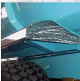
Parafanghi inox o ferro. Stainless steel or iron wings.