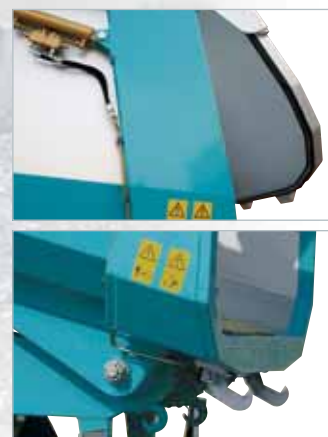
Portellone a chiusura idraulica e perfetta tenuta stagna. Perfectly-waterlight, hydraulically-locked door.

Tutti i veicoli sono omologati per la circolazione stradale in conformità alla legislazione vigente. All vehicles are type-approved for use on the road in compliance with the applicable regulations.