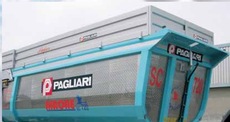
Sovrasponde - Sponda anteriore idraulica. Over-panels - Hydraulic front side panel.