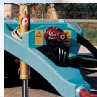
Pompa di ribaltamento tramite motore idraulico, con eliminazione della trasmissione cardanica. The dumping pump is operated by a hydraulic motor, with no need for a cardan drive.