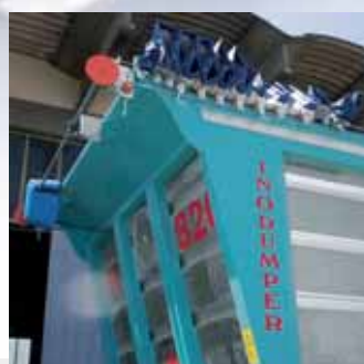
Copertura del cassone del tipo Copri-Scopri, con motorizzazione elettrica od idraulica, per il contenimento dei prodotti polverosi. The dump body is equipped with an electrically- or hydraulically-operated pull on/pull off covering, for covering dusty products.