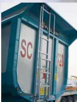
Scaletta di ispezione. Ramp inspection.