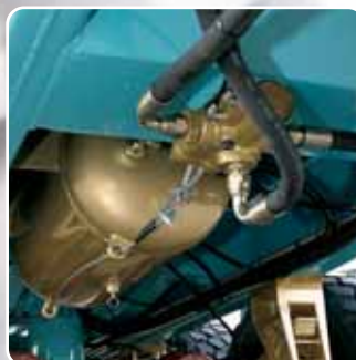
Dispositivo di fine corsa industriale. Industrial-type stopping device.

Il dispositivo di fine corsa è di tipo industriale con possibilità di comando pneumatico per la scelta della velocità di discesa del cassone.