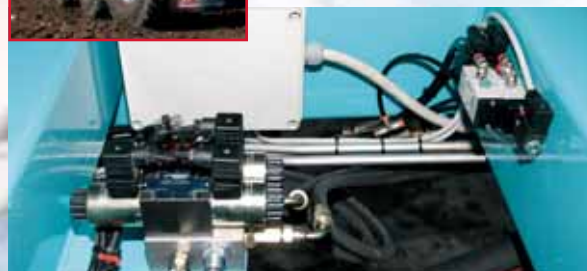
Sistema elettronico per sterzare anche in retromarcia con gruppo elettrovalvole e centralina di controllo del sistema. Solenoid valve unit and control box of the Retrotridem system