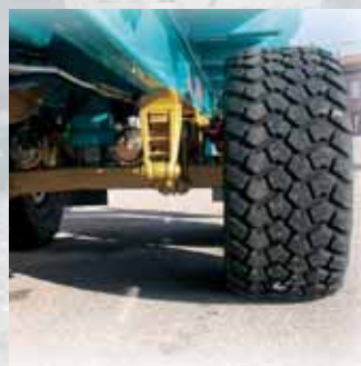
Pneumatici a larga sezione e bassa pressione di gonfiaggio. Large-section, low inflation tyres.